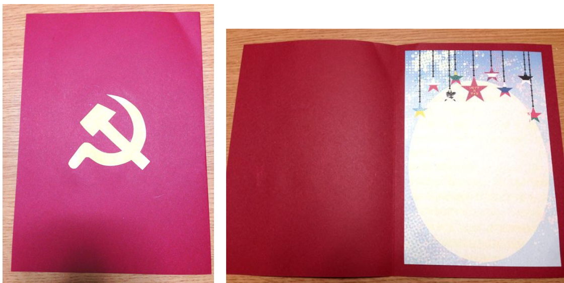
(画像左：メッセージカード裏 画像右メッセージカード内側)

赤い用紙の裏面になる面に「鎌と槌」の形をカッターで切り取り、カードの内側に黄色の用紙を貼り付け、その上からオリジナルデザインのメッセージ台紙を貼り付けました。