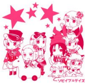
(画像：ハンカチデザイン)