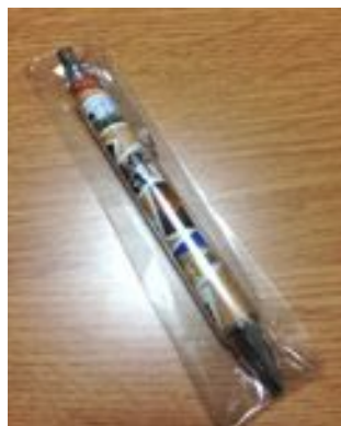
(画像左：ボールペン入稿デザイン 画像右：ボールペン実物)